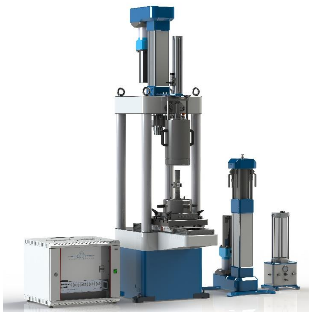
Рис. 2 АСИС для проведения испытания на трехосное сжатие

ООО НПП «Геотек» предлагает разнообразное оборудование на базе комплексов АСИС Про (рис. 2) и АСИС Спец (рис. 3) для проведения испытания на трехосное сжатие скальных грунтов.