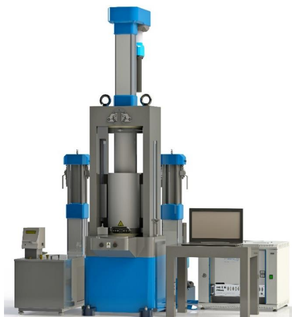
Рис. 3 Установка трехосного сжатия ГТ 1.3.9

В зависимости от потребностей заказчика установка может комплектоваться нагрузочными устройствами, реализующими осевое усилие 100 либо 500 кН, нагнетателями для контроля давления в камере и поровом пространстве (10, 30, 70 МПа), а так же камерами под образцы диаметром 25, 42, 50 и 63 мм. Установка спроектирована таким образом, чтобы максимально оптимизировать работу оператора при установке образца и подготовке опыта: камера размещена на подвижном основании. В состав комплекса входит необходимая измерительная аппаратура высокой точности для измерения малого уровня деформаций. Испытания проводятся в автоматизированном режиме с контролем всех параметров испытания в режиме реального времени.